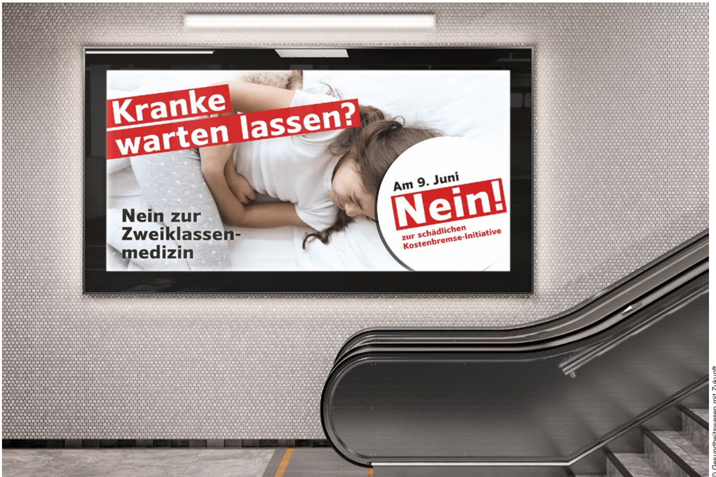
Am 9. Juni geht es um die Zukunft der Patientenversorgung. Es ist darum zentral, wie die Bevölkerung informiert wird.